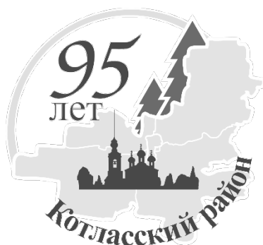
Рисунок 3. Логотип в монохромном варианте