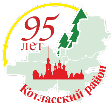
Рисунок 2. Логотип в многоцветном варианте

2.4. Изображения логотипа выполнены в многоцветном (Рис.2) и монохромном (Рис.3.) вариантах.