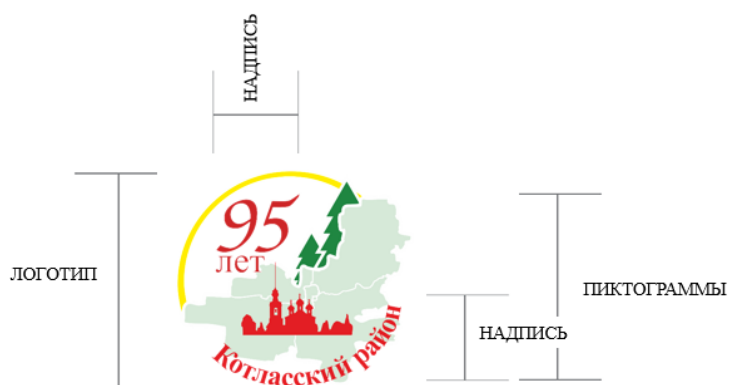
Рисунок 1. Логотип 95-летия МО «Котласский муниципальный район»